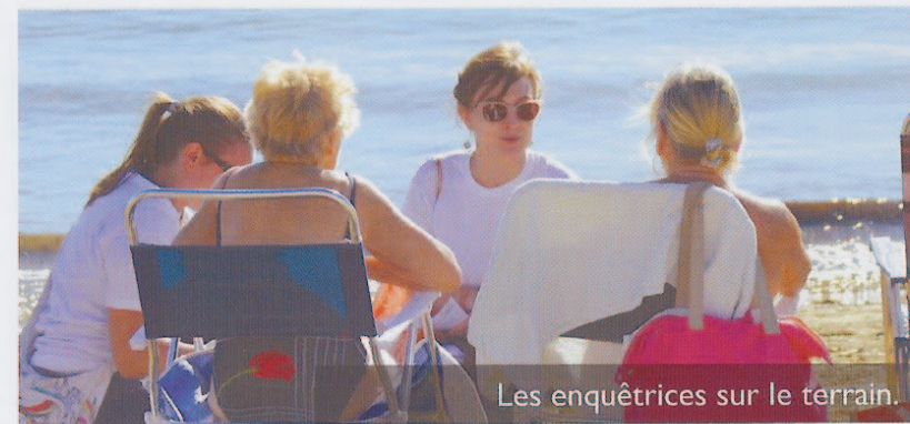
Les enquêtrices sur le terrain.

Leur travail va se poursuivre jusqu'à la fin de l'année.